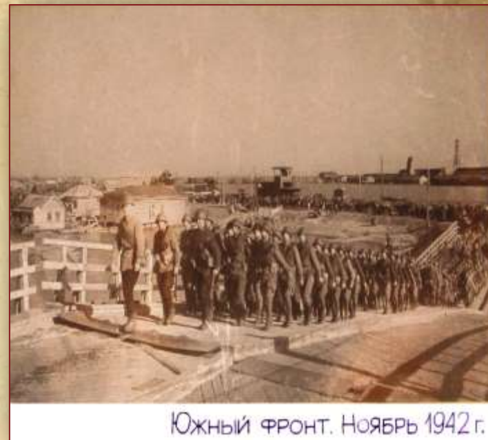
ЮЖНЫЙ ФРОНТ. НОЯБРЬ 1942 г.

4 января 1943 года территория Семикаракорска и Семикаракорского района вновь обрели свободу, избавившись от немецко-фашистских оккупантов.